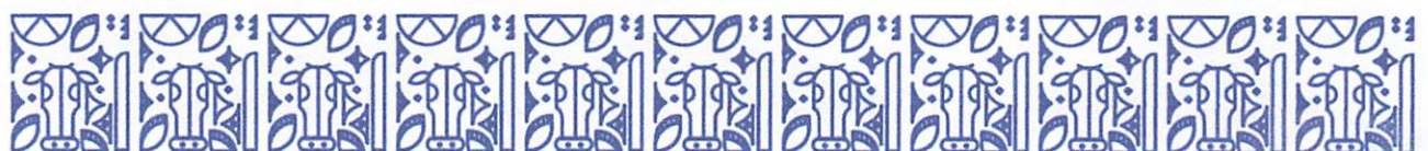
Tabela III. Logradouros públicos e imobiliários